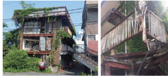
適正な維持管理が行われなくなったマンションの例